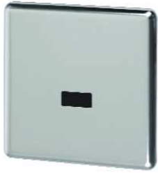
Sensor-Edelstahl-Urinal-Spülkreuz für Druckwasser