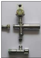
Magnetventil Mischung über DMS-Mischer zur Direktmontage auf Eckventil mit RüVe in KW/WW Eckventil(bauseitig)

Pulverbeschichtung in RAL-Farben und Edelstahlfinish gegen Mehrpreis möglich.