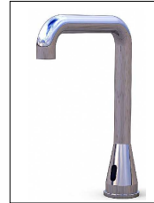
E8 LOex Donau 12VDC