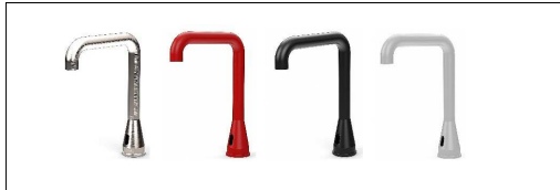
LOex Sens-Inox Tonga2S Ausführungsvarianten in Edelstahl