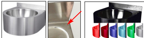
ATM - Antitropfmulde (Schwallrand)