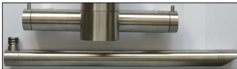
Abb.: Auslauf 300mm

Ausschreibungstext LOex Sens-Inox NIESBA MI Edelstahl(AISI304/DIN 1.4301)- Wand-Sensorarmatur, selbstschließend, bedarfsgesteuert, Festprogramm, mit inliegendem Batteriefach für 9V Lithiumblock- batterie U9VL; Schwenkauslauf, Luftsprudler; Mischbatterie mit individuell verstell- barer Mischeinrichtung