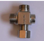
Mischung über T-Stück Zb 023 RI

T-Stück, mit RüVe KW/WW, DN 10, Zugänge u. Abgang in einer Ebene, zur Montage auf Eckventil, 2 Filtereinsätze für Eckventile Anschlüsse 2x3/8"AG 1x3/8"ÜM