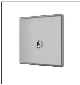
Piezo-Edelstahl-WC-Spülelektronik für Druckwasser