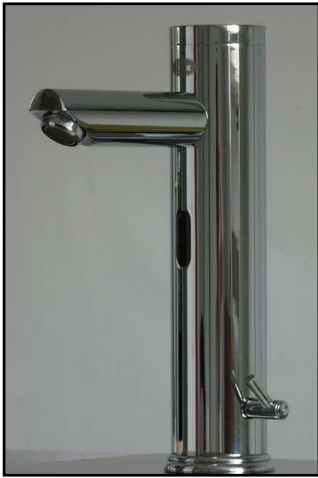
LOex Palau MC2

mit integrierter Mischung für Netz- bzw. Batteriebetrieb